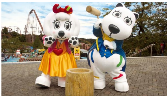
貸出画像「もちつき大会」