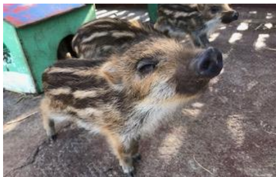
貸出画像「ふれあいイノシシ広場」