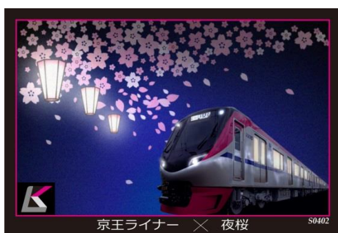
《オリジナルトレーディングカード》

※京王チケットレスサービスの優先予約サービスに登録されているお客様は、7日前の午前6時から購入できます。