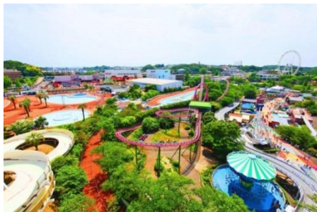
貸出画像「よみうりランド全景」

利用方法 入園口にて、お名前を証明できるものをご提示ください。ご本人様のみ有効。