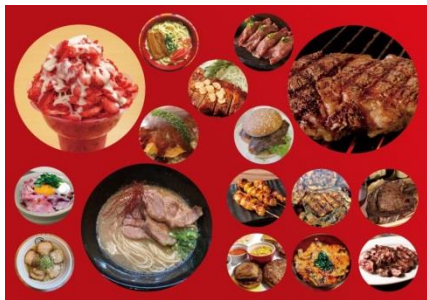
貸出画像「全国ご当地&肉グルメ祭イメージ」