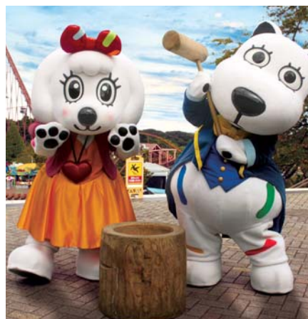
貸出画像「よみうりランドのお正月」