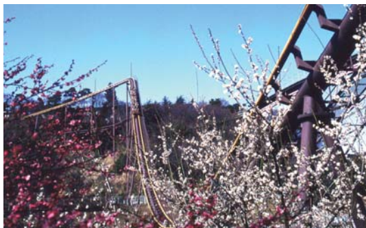
貸出画像「梅の季節に高齢者招待」

よみうりランド恒例の成人式バンジー。新成人はバンジージャンプと当日の遊園地の入園が無料になります。高さ22mのバンジージャンプで新成人の抱負を叫ぼう!