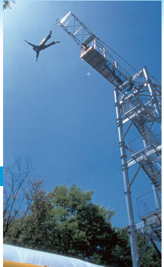
貸出画像「成人式バンジー」