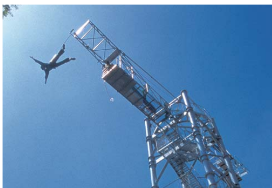
貸出画像「成人式バンジー」

お年玉(入園無料キャンペーン)やもちつき大会などを開催!1月1日(日祝)～1月3日(火)には2017年の干支として大活躍の「鷹」や「フクロウ」が来園し、フライトショーを披露します。