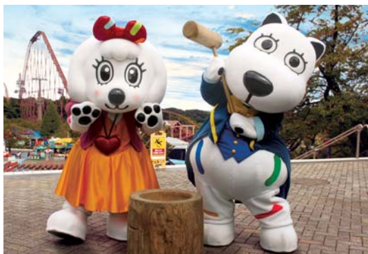
貸出画像「よみうりランドのお正月」