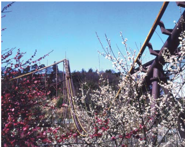
貸出画像「梅の季節に高齢者招待」

よみうりランド聖地公園は園内に寒紅梅、白加賀など約200本の梅が咲く観梅スポット。そんな梅の季節に貴紙(誌)掲載号をお持ちいただくと65歳以上の方とその同居家族の方はよみうりランド遊園地への入園が無料となります。