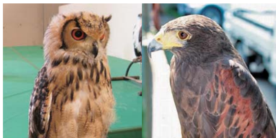
貸出画像「鷹やフクロウがやってくる!」

2017年の干支として大活躍の鷹やフクロウがやってきます。近くで見たり、一緒に写真が撮れるほか、フライトショーも披露します。