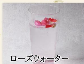
ローズウォーター