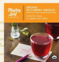
ハーブティー ワイルドベリーハイビスカス