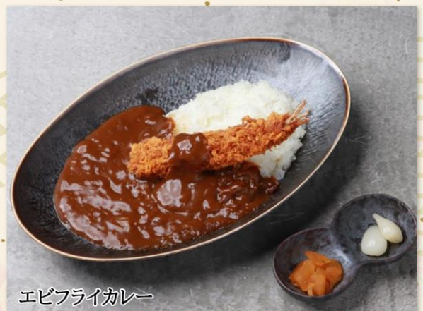
エビフライカレー