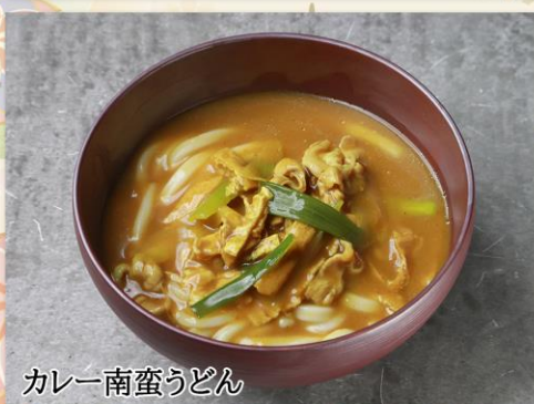
カレー南蛮うどん