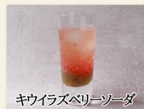
キウイラズベリーソーダ