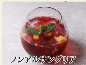
ノンアルサンダリア