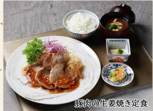
豚肉の生姜焼き定食