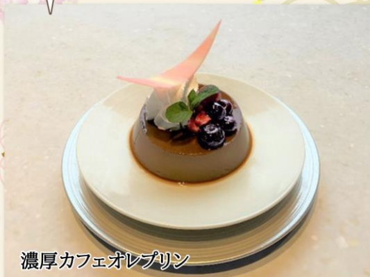
濃厚カフェオレプリン

濃いめのコーヒーに牛乳の優しい甘さを加え、レトロ感を彷彿させる固めのカフェオレプリンです