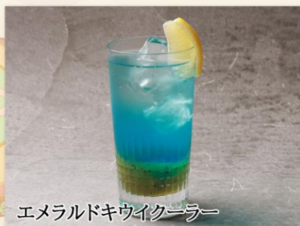
エメラルドキウイクーラー