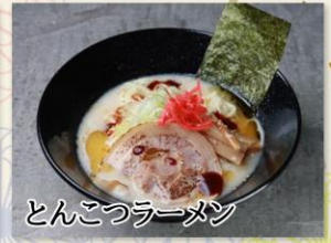
とんこつラーメン