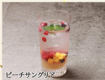
ピーチサンテリア