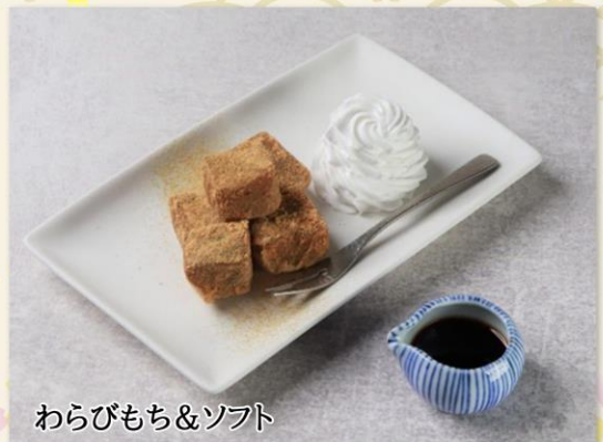
わらびもち&ソフト