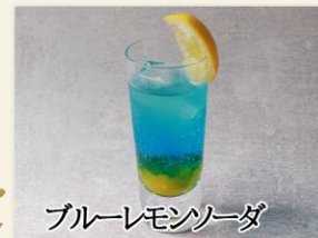
ブルーレモンソーダ