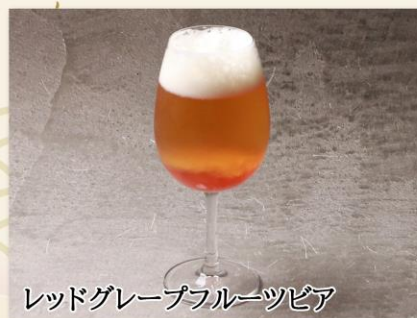
レッドグレープフルーツピア