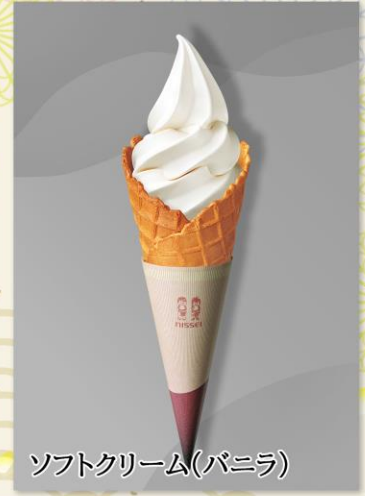
ソフトクリーム(バニラ)