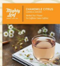
ハーブティー カモミールシトラス

※フラットホワイト エスプレッソのほろ苦い風味とコクに、程よい甘さと100%国産牛乳のまろやかさを加えたヨーロッパスタイルのカフェラテ