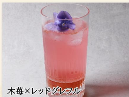
木苺×レッドグレフル