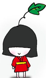
貸出画像③「うりちゃん」

名称：お化け屋敷〜闇霊村(やみろうむら)〜 オープン日：2011年4月29日(金・祝) 料金：300円 ※ワンデーパス・ひよこパス利用可 利用制限：3歳以上(5歳未満要付添) 所要時間：5分〜10分(歩行距離80m)