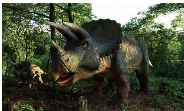
トリケラトプス ■全長……4m ■高さ……1.4m

人気No.1の巨大肉食恐竜。著しく発達した強靱な体を持っていて、特に顎の筋力が凄まじく全ての恐竜の中で最も噛む力が強かったと考えられています。