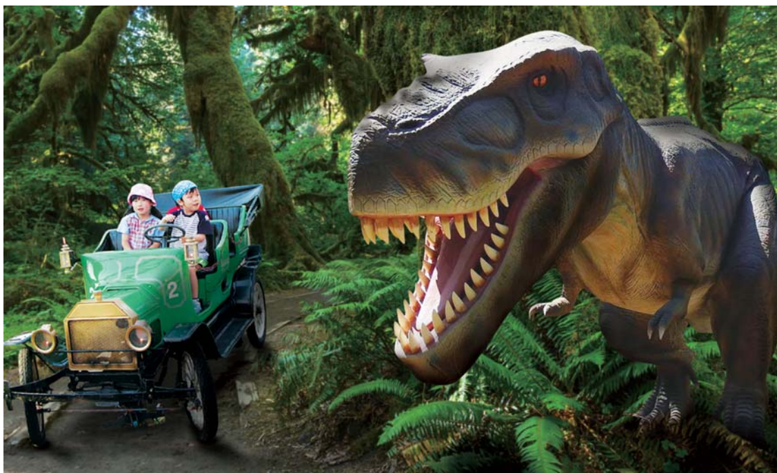
※画像はイメージです。背景のジャングルは実際と異なります。