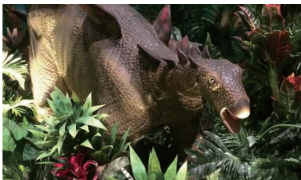
ステゴサウルス ■全長……4m ■高さ……1.76m

背中に並ぶ板が特徴的な草食恐竜。この板は熱を放射し体温を調節するのに役立っていたと考えられています。