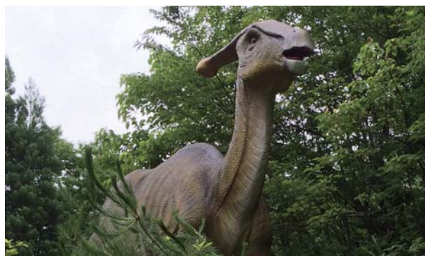
パラサウロロフス ■全長……4m ■高さ……1.8m

背中に並ぶ板が特徴的な草食恐竜。この板は熱を放射し体温を調節するのに役立っていたと考えられています。