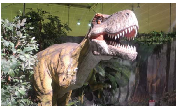
ティラノサウルス ■全長……5m ■高さ……2.3m

人気No.1の巨大肉食恐竜。著しく発達した強靱な体を持っていて、特に顎の筋力が凄まじく全ての恐竜の中で最も噛む力が強かったと考えられています。