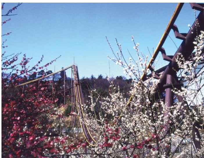
貸出画像「梅の季節にご招待①」