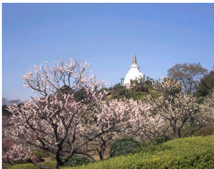
貸出画像「梅の季節にご招待②」