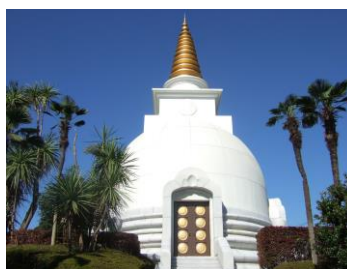
釈迦如来殿(パゴタ)

静かなたたずまいの日本庭園。中央の広大な芝生広場は、春の季節、絶好のお花見スポットとなり、初春には梅が、秋には紅葉がとても美しい。「聖観音菩薩像」、「妙見菩薩像」の2つの重要文化財をはじめ、仏教遺跡を巡る散策も楽しめます。スリランカの寺院を模し、御影石で作られた四面向拝の殿堂「釈迦如来殿(パゴタ)」には2500年前に入滅した釈迦の仏舎利と聖髪が収められている。