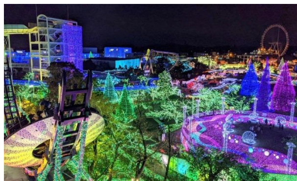
よみうりランド「ジュエルミネーション®」 (今シーズンの様子)