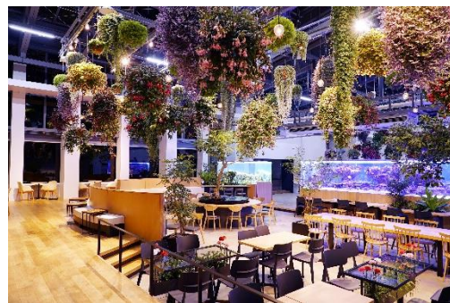
貸出画像「夜のHANA❀BIYORI館内」