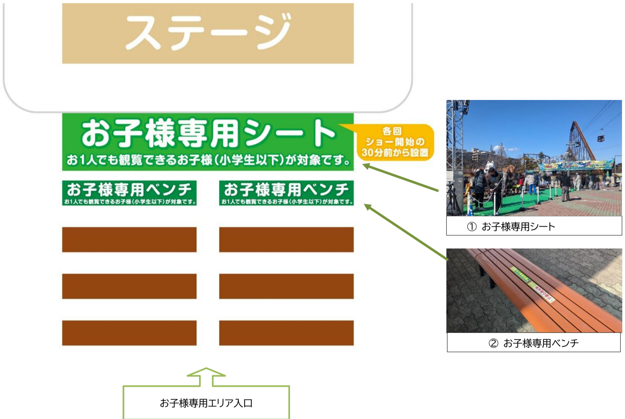
① お子様専用シート

保護者の方の同伴はできませんので、お1人で観覧できるお子様が対象となります。 ※「お子様」:小学生以下